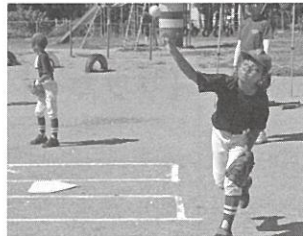
小・中学生が参加するスクール活動