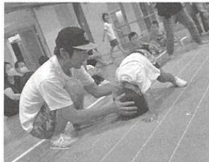
親子でも参加できる幼児体操教室