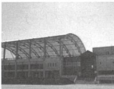
クラブハウス外観

クラブハウスは成岩中学校の敷地内にあり、地域の方々がご家族やお友達と気軽にご利用いただける施設となっております。 OPENの時間帯には好きなスポーツを楽しむことができます。その他、スポーツ以外にも、カフェテリアで勉強をしたり、ジャグジー付きのお風呂でリラックスしたりと様々にご利用いただけます。