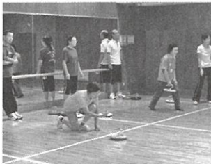
全世代向けのサークル活動

未就学児から高齢者までを対象としたスポーツ活動を行っており、健康・体力づくりや専門種目の技術向上など様々な目的で地域のみなさんにご参加いただいております。