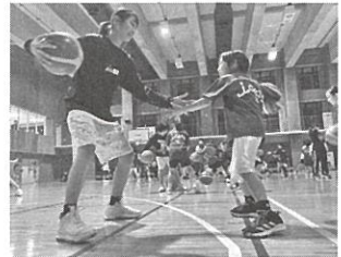
アスリートから指導を受けられる アイデアトレーニングアカデミー