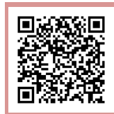
見学会申込みフォーム

事前に見学をされたい方は右記専用フォームより お申込みください。 なお、上記日程以外でも随時見学等可能ですので ご連絡ください。