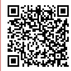
2025年新1年生 登録申込みフォーム